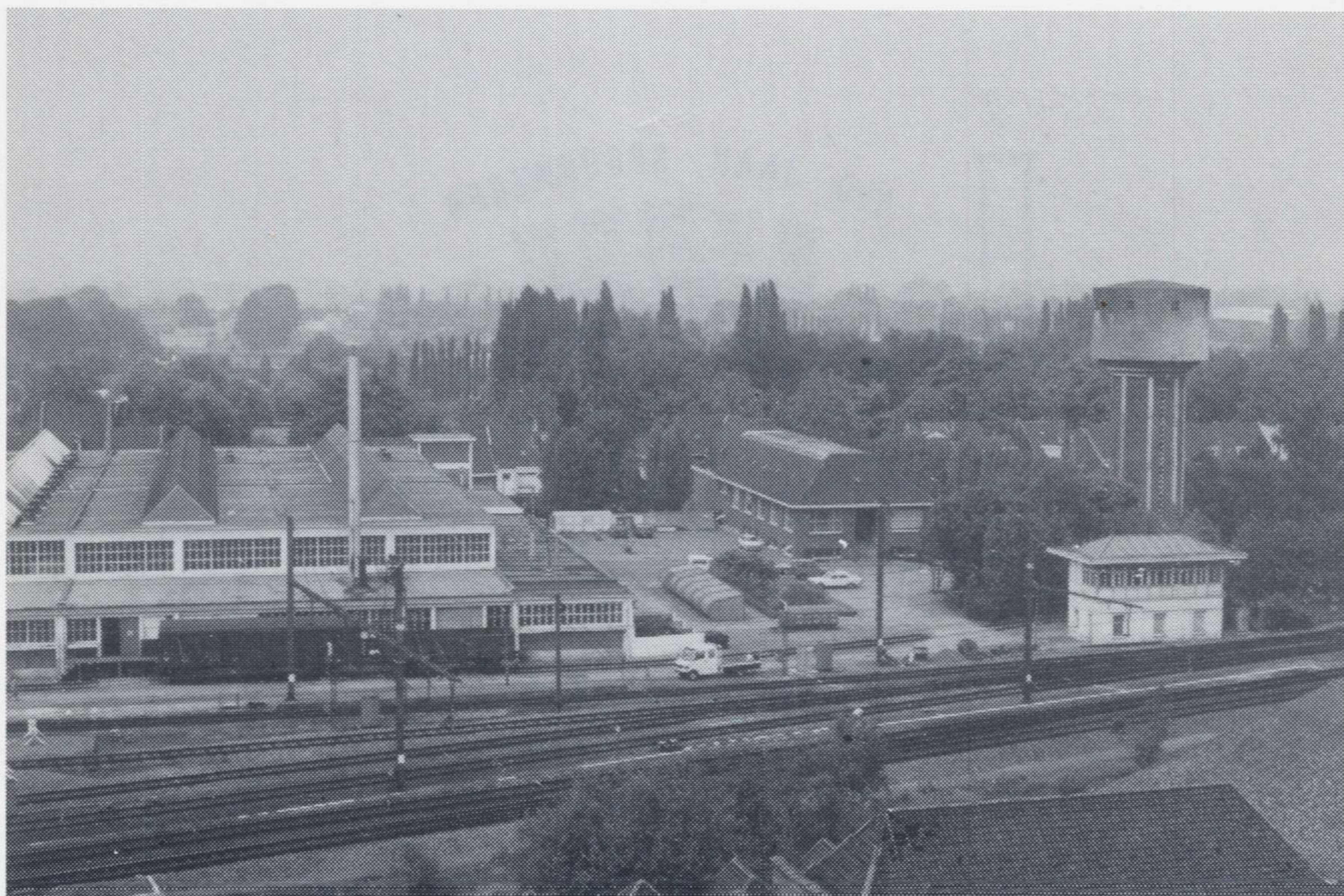
1. Algemeen gezicht op de werkplaats.

De installaties zijn ingeplant naast de spoorlijn Kortrijk - Moeskroen, ter hoogte van het vormingsstation.